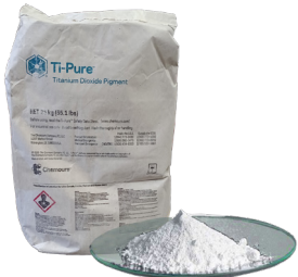
Bióxido de titanio CHEMOURS