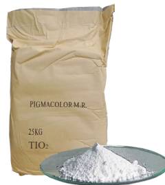
Bióxido de titanio PIGMACOLOR