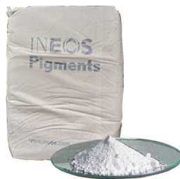
Bióxido de titanio TIONA